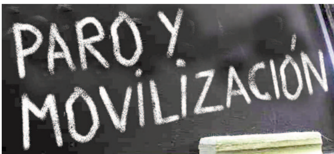
Docentes bonaerenses paran y se movilizan mañana.

Los sindicatos bonaerenses convocan a la medida de fuerza pidiendo más presupuesto para la educación en general y para las universidades, y contra la reforma jubilatoria. Asimismo, reclaman por el Fonid, un fondo nacional quitado por Milei que complementaba el salario de docentes de escuelas en las distintas provincias.