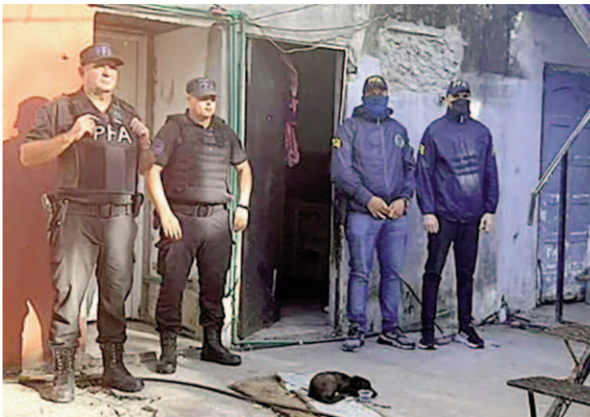
Malestar de policías federales por las malas condiciones que sufren en Rosario.

«Si queremos merienda o desayuno, lo tenemos que pagar de nuestro bolsillo y con lo que nos pagan no hacemos nada. No nos alcanza. Al principio nos incluían el desayuno, podíamos repetir un segundo plato en el almuerzo o la cena y nos daban gaseosa o agua saborizada, pero desde hace un tiempo nos negaron todo eso y recibimos solo agua en las comidas»,