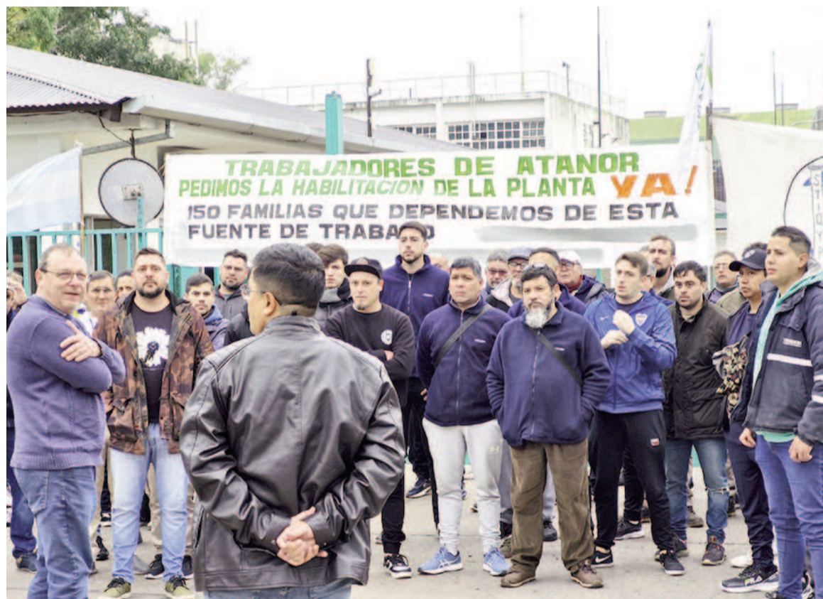
El Sindicato de Químicos pidió al Ministerio una medida que frene los 27 despidos que la empresa ya habría informado.

convocado para hoy. Habrá que ver no sólo cuál sea esa respuesta empresarial, sino también si existe una medida adoptada por el delegado regional.