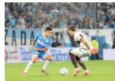
del conurbano bonaerense entre Lanús y Gimnasia, en un choque sin emociones.