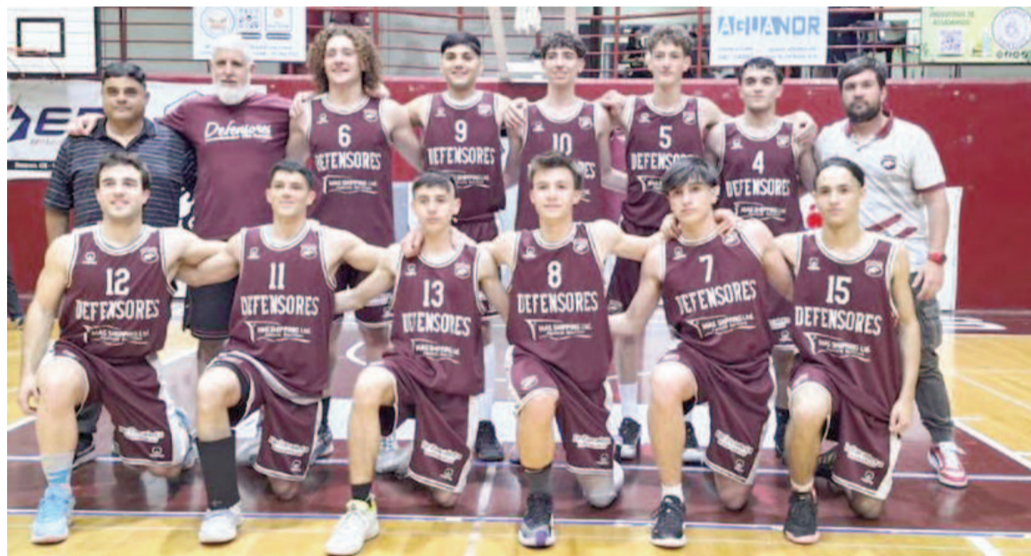
Defensores "A" es uno de los tres invictos que tiene la competencia junto a Somisa y Regatas "A".

Los próximos choques de la competencia serán: Los Andes-Somisa, Regatas "B"-Defensores "B", Belgrano "A"-Don Bosco, Sacachispas-La Emilia y Social-Regatas "A". Tendrán descanso Mitre, Defensores "A", Belgrano "B" y Riberas.