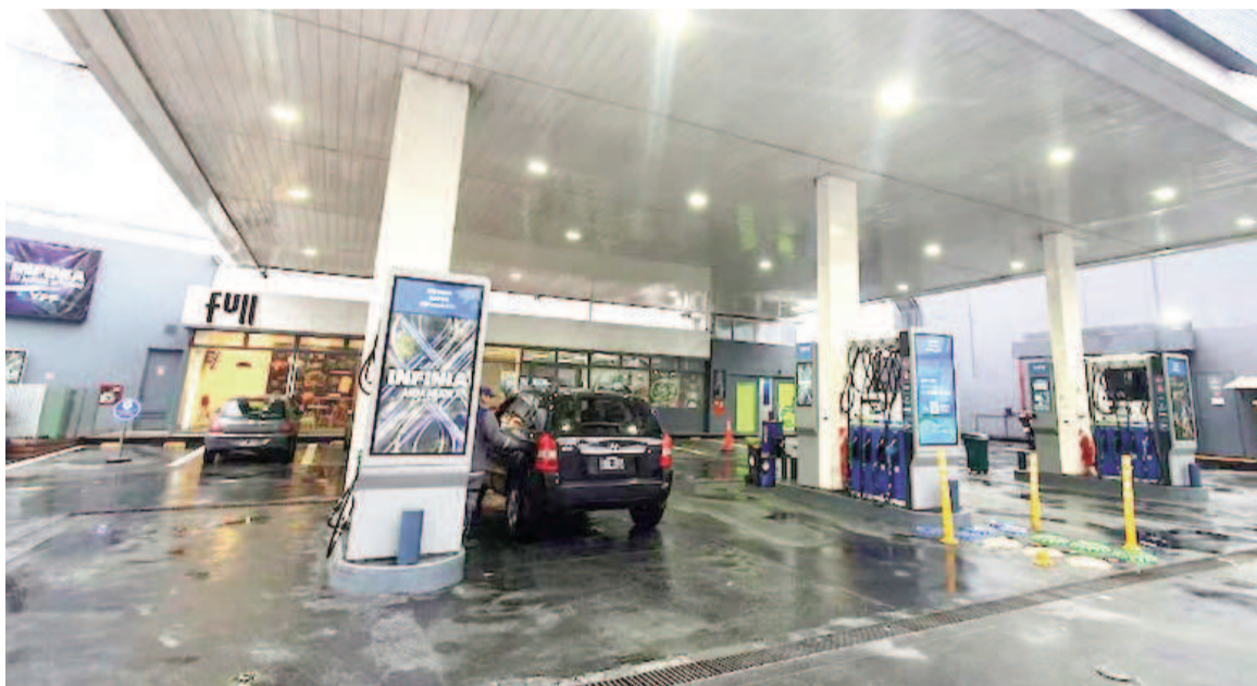
YPF bajó los precios de sus combustibles.

“Además, hay que entender si no resulta muy prematura esa baja de precios ya que no se sabe si la reducción del precio del crudo se extenderá en el tiempo. Esta iniciativa de bajar precios, significa un doble esfuerzo para la industria, pues se absorbe también la suba del 1% del impuesto y del 2% del