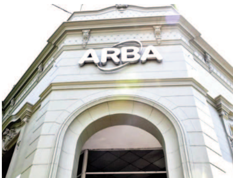
Cayó la recaudación en provincia de Buenos Aires.

Sin embargo, desde la provincia celebraron estos datos. Al conocerse este informe, un funcionario bonaerense sostuvo que "la mejor publicidad de gestión de recaudación proviene