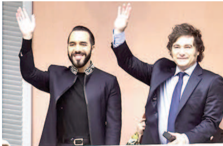
Milei y Bukele saludaron desde los balcones de la Casa Rosada.

Los dos mandatarios coincidieron hace unos pocos días en la Asamblea General de las Naciones Unidas donde volvieron a evidenciar su buena sintonía, con la coincidencia en temas puntuales como el rechazo al rol de