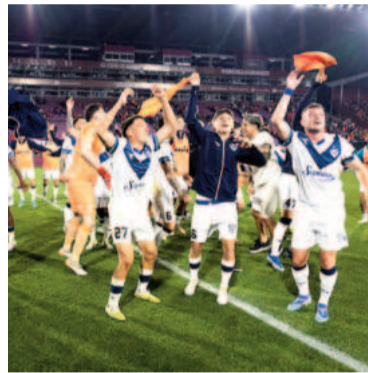
Vélez es puntero del torneo y viene de eliminar a Independiente en la Copa Argentina.