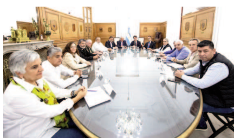
A cinco meses de su primera y única reunión oficial, el Gobierno y la CGT volverán a encontrarse.