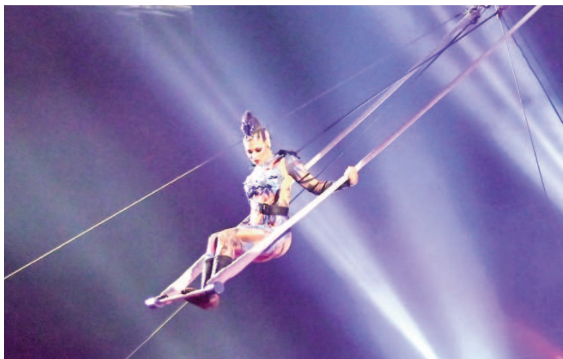
«El gran sueño», un show a puro dinamismo que busca concientizar sobre el cuidado del medioambiente.

Las funciones tendrán lugar en el predio detrás de la UOM en Villa Constitución, este jueves y viernes a las 20:30. Mientras que el sábado