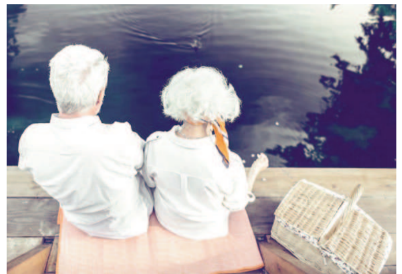
Día Internacional de las Personas de Edad.

Este día se celebra el 1º de octubre de cada año. La fecha fue elegida para coincidir con el inicio del mes en el que tradicionalmente se dedica a reflexionar sobre el envejecimiento y sus implicaciones, como la relevancia de la promoción de biotecnologías innovadoras basadas en evidencia para prevenir los procesos degenerativos del envejecimiento, extendiendo así la vida activa y saludable. La primera celebración oficial tuvo lugar en 1991. Cada año, las actividades y eventos organizados en torno a esta fecha varían, pero generalmente incluyen conferencias, debates, programas educativos y campañas de concienciación sobre los derechos de las personas mayores. En América Latina y el Caribe actualmente hay 84.9 millones de personas mayores, que representan el 13% de la población de la región, en el 2030 este grupo de población representará el 16.7% y en 2050 1 de cada 4 latinoamericanos y caribeños será adulto mayor. Esta realidad es consecuencia de mejoras en el ámbito de la salud en cuanto a políticas públicas que optimizaron la calidad de vida en general de las personas de edad. Si bien esto es significativo, el segundo paso es crear programas de inserción a esta nueva ola tecnológica para,