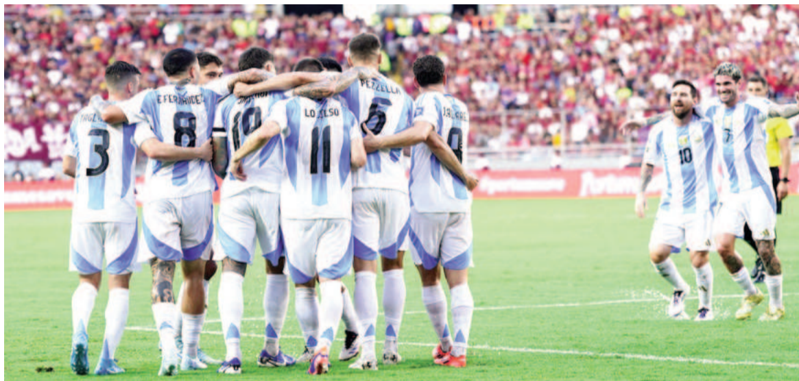
Argentina viene de empatar 1 a 1 en Venezuela y sigue primera. WEB

El encuentro tendrá lugar a las 21 del martes frente a un rival que viene dando resultados sorpresivos en las Eliminatorias Sudamericanas y se ubica