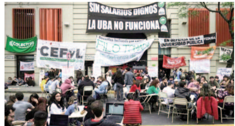
Hubo 25 facultades tomadas en las últimas horas.