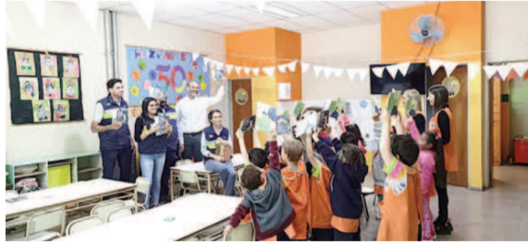
Desde hace más de 10 años, Bunge viene trabajando junto con la Fundación Leer en programas que promueven la lectura en los niños en edad escolar.

Los voluntarios visitaron un total de 21 instituciones educativas de nivel inicial, junto con cuatro de sus anexos situados en algunas de las zonas donde Bunge tiene operaciones: Ramallo, Campana, Necochea, Ingeniero White (Buenos Aires), Avia Terai y General Pinedo (Chaco), General Paz y Tancacha (Córdoba), Piquete Cabado (Salta), Cayastá, Puerto General San Martín, San Jerónimo Sud (Santa Fe), Frías y Bandera (Santiago del estero), Delfín Gallo (Tucumán). Al finalizar la actividad, los 1060 estudiantes -de salas de 5 años-