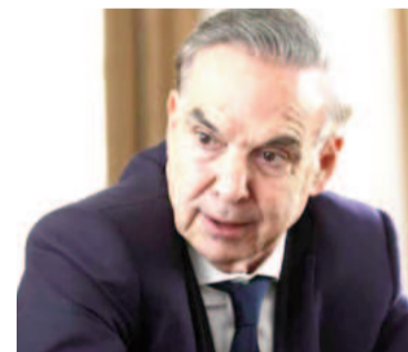
Diputado nacional Miguel Pichetto.

Tras esa introducción, el referente de Encuentro Federal criticó la postura de algunos miembros del clero que, según él, “devalúan la política cuando juntan un poco de gente en la Basílica de Luján” y tienen “ideas estúpidas” sobre la pobreza: “Creen que la salida es con un plan o abrien-