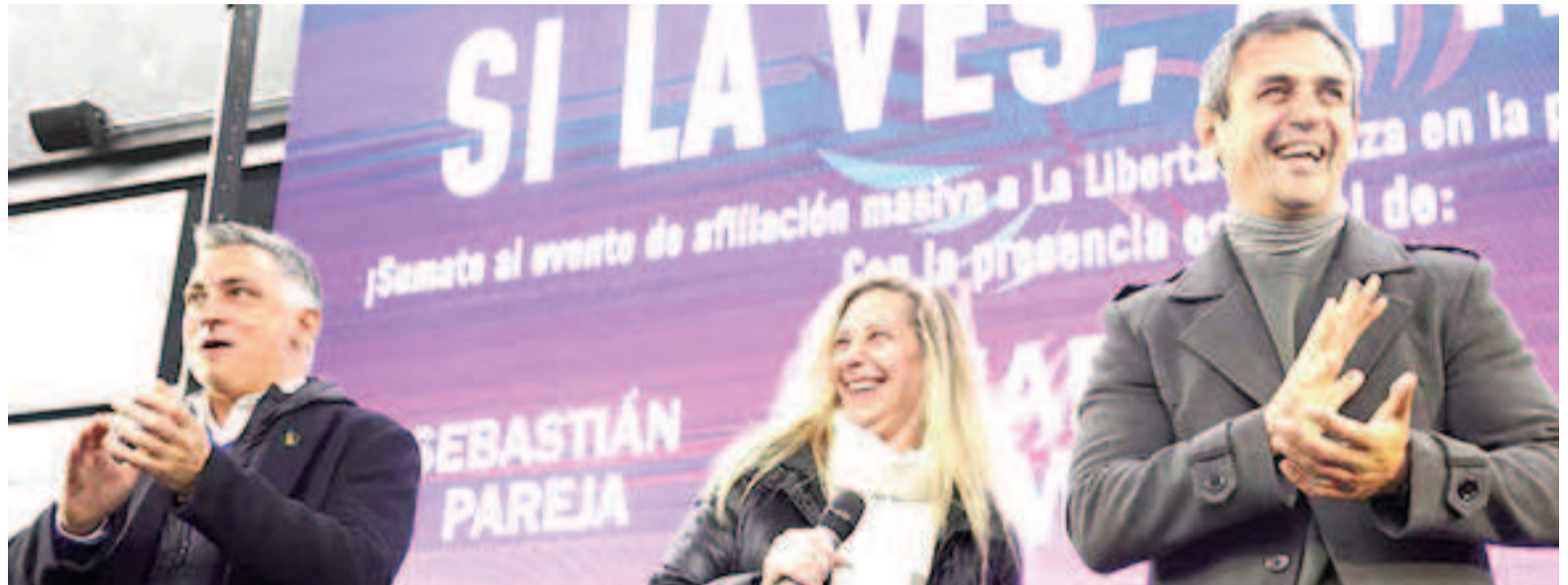
Sebastián Pareja, Karina Milei y Martín Menem juntos en La Plata.

Karina Milei estuvo acompañada por el vicepresidente del partido, Martín Menem y el presidente de LLA en la provincia de Buenos Aires, Sebastián Pareja, en un acto en el Club COPARA de Villa Elvira, La Plata. Ante una multitud presente, la presidente del partido afirmó: "Quieren que este gobierno fracase. Les pido por favor, juntemos fuerzas, redoblemos los esfuerzos para poder llevar las ideas