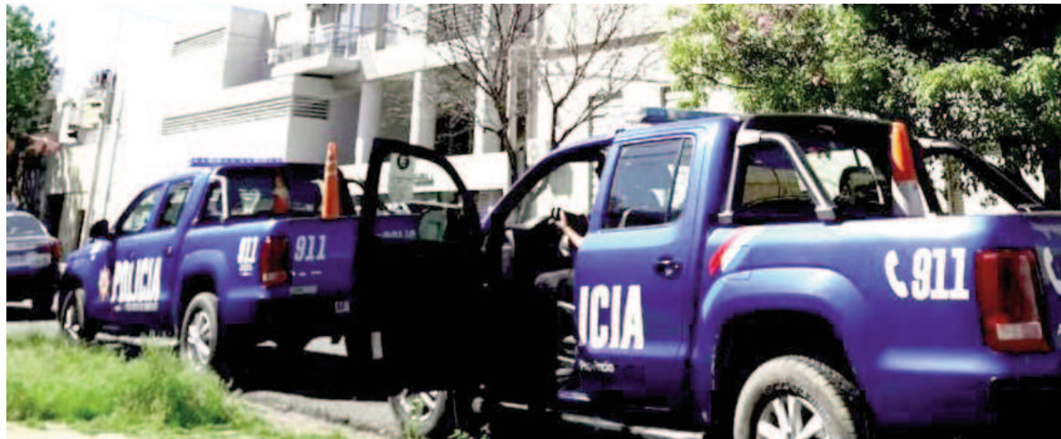
El cuerpo fue encontrado en el jardín de un edificio ubicado en Catamarca al 3100.

Sobre el fallecido, circuló la versión de que podría tratarse de un hombre de unos 45 años. Al respecto, policía y Justicia trabajan en su identificación.