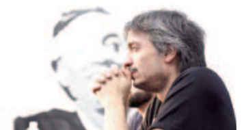
Diputado Máximo Kirchner.

También sostuvo que «lo que se viene va a ser durísimo pero si encima nos alejamos y nos pelamos va a ser mucho más difícil todavía. Debemos